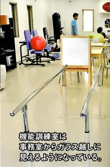
機能訓練室は事務室からガラス越しに見えるようになっている。