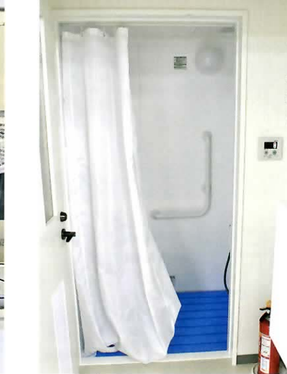
シャワールーム 入浴サービスはないが、シャワールームはある。特に夏場には必要な設備。

仁コーポレーションは、スタートからわずか3年で、事業を次々と展開している。2009年に、福岡市博多区祇園町（旧矢倉門町）で、医療法人護健会から宮原医院デイサービスセンターを譲り受け、「デイサービスやぐらもん」を開設した。デイサービスやぐらもんは、市街地の中心部にあり、規模は大きくない。それでありながら、活動のメニューが多岐にわたり、それぞれが本格的であるということから、業界誌でも取り上げられるようになり、地元のケアマネジャーからも「楽しいデイサービス」として評価が高まった。